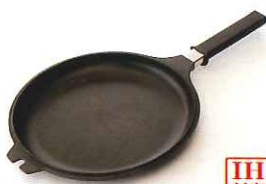
●フタ [NQB-A] 内径23.6cm 深さ2.3cm