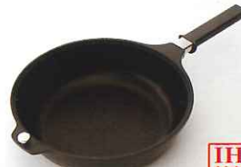
●深なべ [NQB-C] 内径23.6cm 深さ6cm