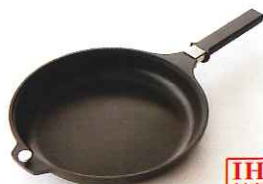
●ベーカー [NQB-B] 内径23.6cm 深さ3.5cm