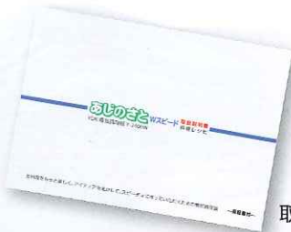
取扱説明書(料理レシピ付)